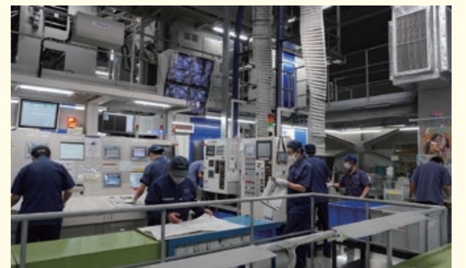
最終的に人の目でチェック!