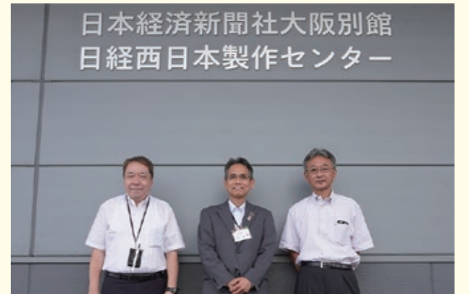
左から中込常務、大東区長、丸山社長

※地球環境を守ることを経営の基本理念とするなど、SDGsやISOの観点から、工場内の紙やインク等の資材は循環させるシステムが確立されていました。