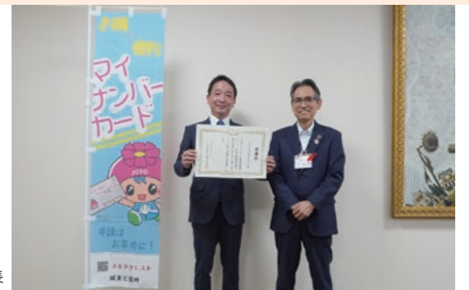
左から秋田代表取締役社長、大東区長

大希産業株式会社様より、のぼり旗60枚をご寄附いただきました。城東区にて、マイナンバーカード普及啓発に活用させていただきます。ご寄附に感謝するとともに、お礼を申し上げます。 問合せ: 総務課 ☎ 6930-9625 FAX 6932-0979