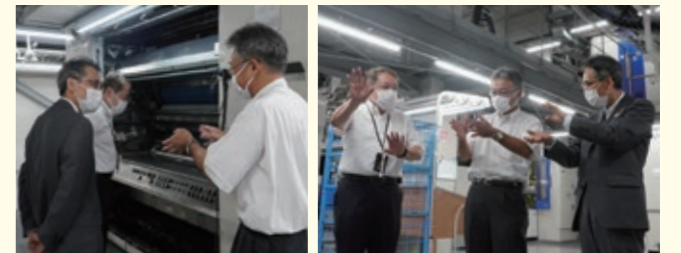
システム化された工場内を見学しました。