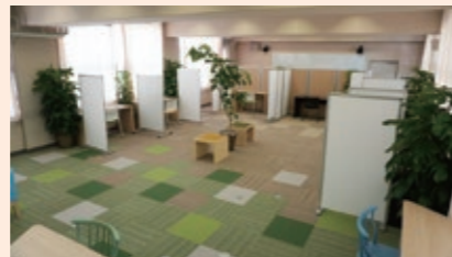
【蒲生中学校】 写真左: 開放感のある スペース 写真下: 左から大東区長、 飯森校長

不登校生徒が少しでも学校に行きたいと思えるような取組みをどんどん進めていきたいと考えています。