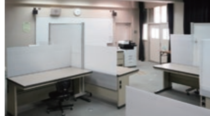
【董中学校】 写真左: 個別空間が 落ち着きます 写真下: 左から大東区長、 箕輪校長