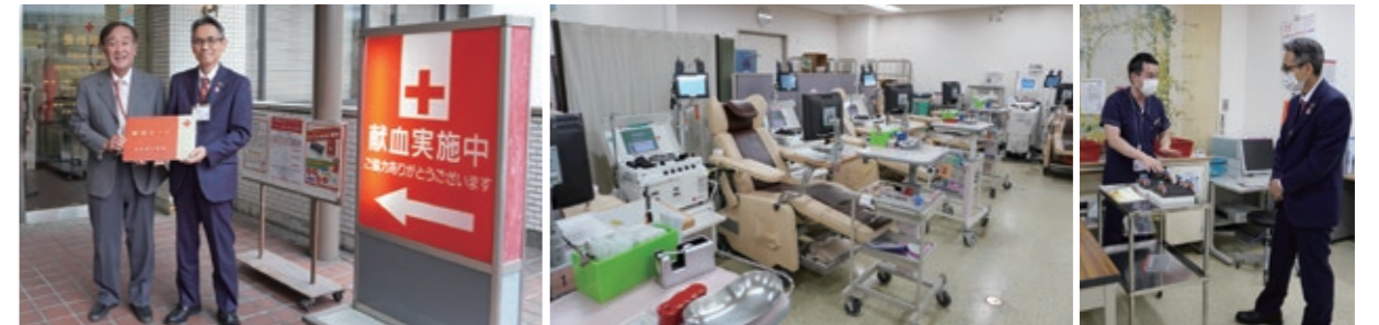
左から大阪府赤十字血液センター 谷 所長と大東区長 ゆったりとした採血エリア 採血の説明を受ける大東区長

献血した血液は、そのままの状態では医療機関に届けられるものではありません。いくつかの製造工程を経て、患者さんの元に届けられています。また、血液は長期保存ができないため、需要の増減を見極めながら、供給量を管理しているそうです。