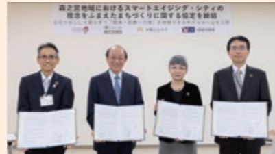
左から大東区長、大道社会医療法人大道会理事長・森之宮病院 院長、樋口大阪公立大学大学院リハビリテーション研究科 研究科長、田邊UR都市再生機構西日本支社大阪エリア経営部 部長

10月31日、城東区役所は森之宮病院、大阪公立大学およびUR都市機構と新たに「森之宮地域におけるスマートエイジング・シティの理念をふまえたまちづくりに関する協定」を締結しました。