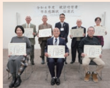
伝達式に出席された皆さん

統計功労者市長感謝状は、統計調査の業務に従事し、その成績が優秀な方を表彰するもので、区長からその伝達を行いました。皆さんの功績に敬意を表し、心よりお祝い申し上げます。