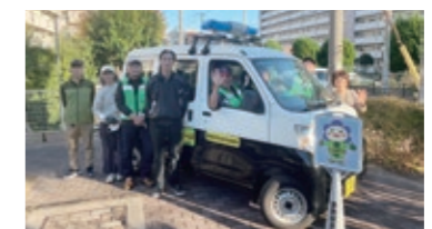
昼夜問わずに、区内をパトロールしています! 董地域活動協議会の皆さん

かを見守っています。小学校の校長先生の声を録音してアナウンスをしたり、夏休み期間に夜間パトロールを行ったりと各地域で児童の安全のために、アイデアや工夫を凝らして見守り活動を行っています。活動は地域住民の皆さんによるボランティアで行われています。「青パト」を見かけた際には、笑顔で見守ってください。