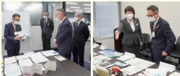
環境に配慮した製品を拝見しました

※「印刷からSDGsを考える」をコンセプトに、バイオマスインキの使用・プライバシーマークの取得などに取り組んでおられます。