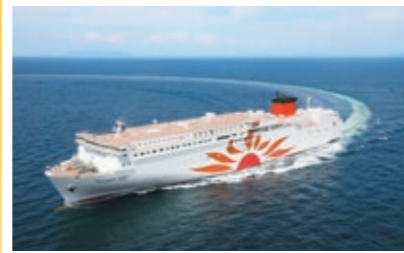
①フェリーさんふらわあ