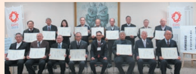
16地域活動協議会会長の皆さんと大東区長

各地域活動協議会がペットボトルを回収することでリサイクルの推進と、再資源化事業者への売却益を地域コミュニティへ還元し活力ある地域社会づくりに貢献されました。