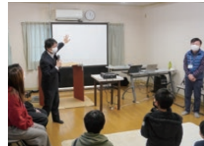
高田教授からの講義

※今福老人憩の家では、今福プログラミング教室を毎月第三日曜日(中高生が参加しプログラミングを開始)、ナレッジラボを毎週水曜日(スマホの操作や子どもの居場所づくりなど)に実施しています。