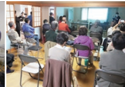
ロボット等のお話に興味津々の皆さん