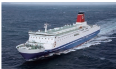
フェリーふくおか

大阪港に就航する大型フェリーで、明石海峡大橋を眺めながら、大阪湾をめぐる。定員300人。小学生以下は保護者同伴。