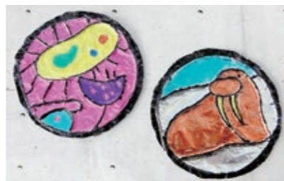
マンホールふたデザインのイメージ

自分だけのマンホールふたのデザインづくりを通して、下水道や水環境について親子で学べるワークショップなどを開催。日時はプログラムによって異なります。詳しくはHPをご覧ください。