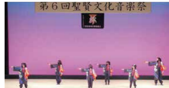
みんなで楽しむ文化音楽祭♪

コロナ禍により、3年ぶりに開催された第6回聖賢文化音楽祭。5歳の子どもから80代の方まで21組300人の出演者が日ごろの練習の成果を存分に発揮され、活気あふれる音楽祭になりました。毎年11月3日に出演者も入場者も無料で開催していきます。