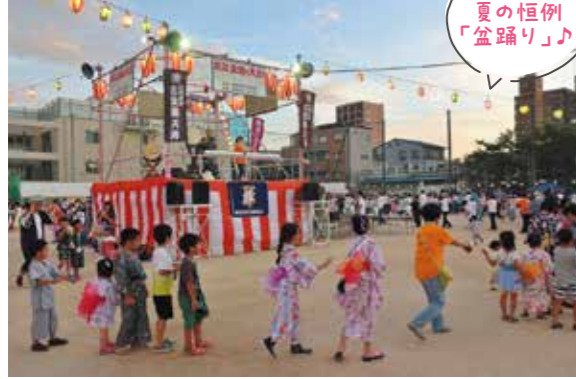
楽しい夏の恒例「盆踊り」♪

長いコロナ禍で地域活動は停滞していましたが、昨年から少しずつ行事を再開してきました。今年は集大成として「盆踊り」の再開をめざします。地域の皆さんが楽しみにしている大きな行事です。盆踊りに限らず、各種行事にはボランティアの皆さんのご協力が不可欠です。諏訪在住の方でご協力いただける方は諏訪会館、もしくは町会長へぜひ、ご連絡をお願いします。