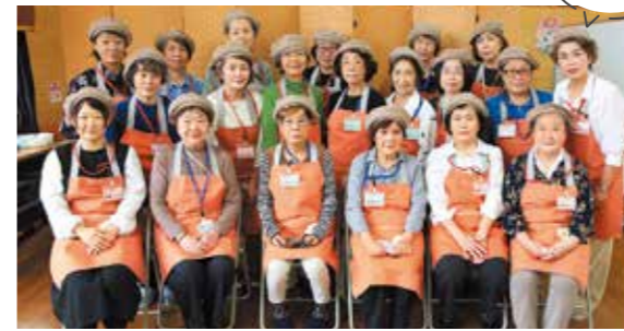
参加をお待ちしています!

4年ぶりに再開したふれあい喫茶。参加のお客さまも楽しみにしてくださっていたようで、徐々に城東福祉会館内がコーヒーの香りとにぎやかな話し声に包まれました。スタッフのユニフォームもパンの種類もリニューアル、心機一転、毎月第1・3日曜日に開催しますので、ぜひお越しください。