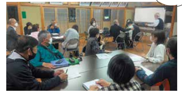
「支え合い活動」実施中!

鳴野地域活動協議会では、核家族化が進む中、ちょっとした、地域住民同士の支え合い・助け合いで、困りごとを軽減・解決していくつながりづくりの仕組みとして「支え合い活動」を進めようと部会や各町会で話し合い取り組んでいます。