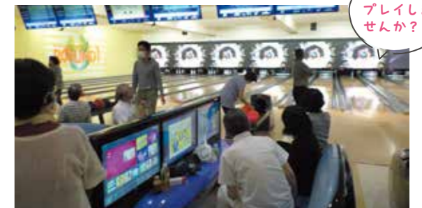
一緒にプレイしませんか?!

ツツジの花が咲き誇る頃、地域のボウリング場のフロアを貸し切って町内会対抗のボウリング大会を開催しました。小さな子どもさんからシニアの皆さんいっしょに楽しみました。当日のフロアには、手から勢いよく離れたボールがレーン横の溝に勢いよく吸い込まれるガーターに笑いがひろがりました。