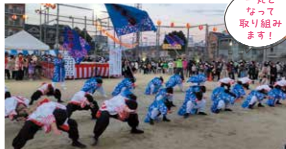
一丸とって取り組みます!

夏は状況が難しいため、「必ず開催」の意思統一のもと、まつりを11月に変更し3年振り復活を果たしました。新たにコミュニティの場として生まれた「ほほえみひろば」。世の中の激変に対応するためHUG(避難所運営ゲーム)で意識とマニュアルの更新を行います。