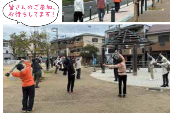
皆さんのご参加、お待ちしております!

3月24日(金)2回目のノルディックウォーキングを実施。参加者24名、前夜からの雨も上がり、すがすがしい朝でした。好評なのでこれからも続けていきます。5月からは、ふれあい喫茶や食事会の再開が進んでいます。