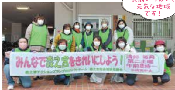
笑顔いっぱい、元気な地域です!

3年ぶりに念願の森之宮フェスティバルが実施されました!仮装した子どもたちのあふれる笑顔、老若男女の楽しい笑い声。地域外からもご参加いただき大盛況でした。また地域活動活性化のため「クリーンアップ大作戦」の横断幕とピブスを作成しました!