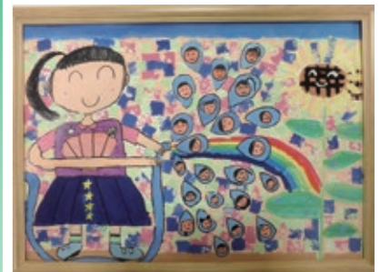
令和4年度 特選賞(2年生)