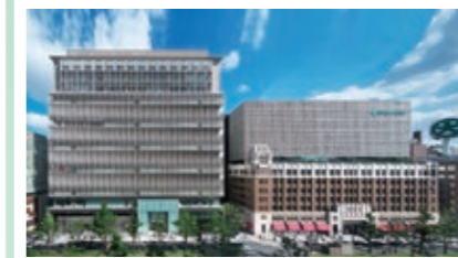
第41回大阪市長賞：大丸心斎橋店本館・心斎橋PARCO