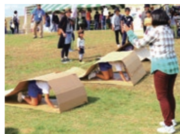
ダンボールキャタピラー