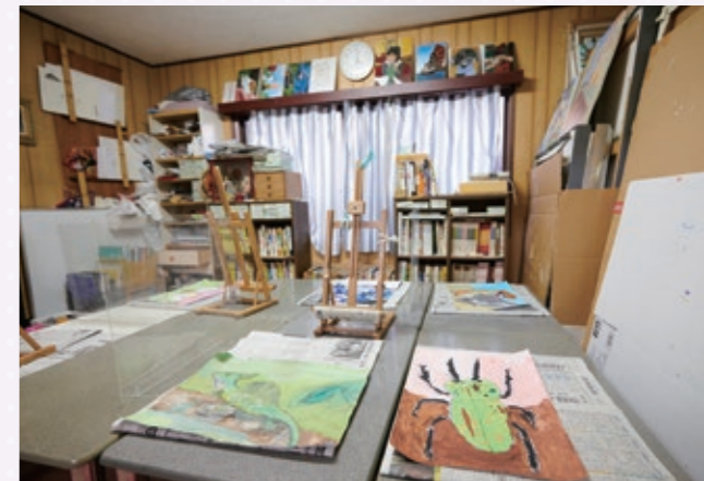
▲子どもたちの作品