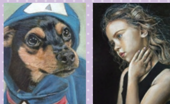
▲今にも動き出しそうな作品の数々