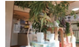
▲フロント前にある観葉植物たち

道路に面する大きな窓から燦爛と陽が降りそそぐ広い休憩スペースには、ソファや観葉植物が設置され、地域の方のコミュニケーションの場ともなっています。平成の銭湯の特徴であるフロントが中央にあり、リニューアルを経てお風呂の種類も増えたそうです。