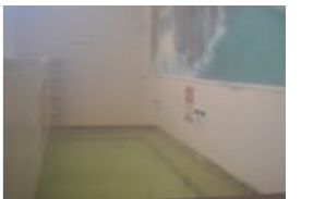
▲新たに導入された高濃度炭酸泉

令和4年8月に大規模改修され、倉庫だったスペースにコワーキングスペースが誕生しました。休憩用のフリースペースや、パソコン作業ができるデスクが設置され、テレワークができる個室ブースや会議室もあるなど、新しい銭湯の形といえます。