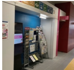
区役所1階広報誌ラック

各地域活動協議会の広報ボランティアの方が、お祭りやスポーツイベント、防災や防犯キャンペーンなどさまざまな取組みを広報誌やSNSで情報発信しています。少しでも安心・安全で、住みよい暮らしができるよう、行事だけでなく、ごみの日やクリーン作戦など日常生活に欠かせない情報も掲載しています。