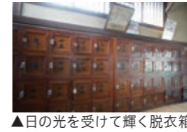
▲日の光を受けて輝く脱衣箱

のれんをくぐると、今はあまり見ることのない番台、脱衣所にはヒノキの一枚板で作られた脱衣箱。まさに昭和レトロといった歴史を感じる空間が広がっており、この風景だけでも一見の価値があります。開業当初からある番台や脱衣箱は、深い色合いと光沢が美しく、これまで大事に手入れされてきたことが伝わってきます。