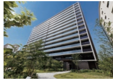
カサレ ウェストゲートシティ(住之江区)

第36回大阪市ハウジングデザイン賞表彰式にあわせて、シンポジウムを開催。これまでの受賞者とともに過去の受賞住宅を振り返りながら、これからの都市型集合住宅に求められるものについて考えます。定員100人(先着順)。