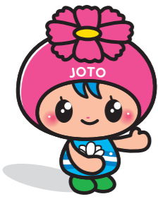
城東区マスコットキャラクター「コスモちゃん」

城東区役所では、今年度重点的に取り組む施策をまとめた「運営方針」を策定しました。区民の皆さんにとって、「住んでよかったと思えるまち」となるよう取組みを進めていきます。