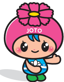
城東区マスコットキャラクター「コスモちゃん」

城東区役所では、今年度重点的に取り組む施策をまとめた「運営方針」を策定しました。区民の皆さんにとって、「住んでよかったと思えるまち」となるよう取組みを進めていきます。