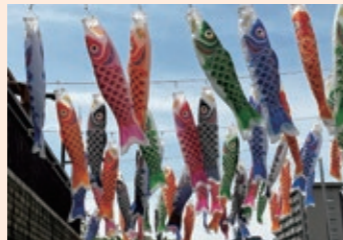
城北川を彩るこいのぼり

城北川の今福大橋周辺で「泳ぐこいのぼり大作戦」を開催しました。近隣にある保育園の園児たちや、ゴールデンウィークということもあり、家族づれの方が泳ぐこいのぼりを楽しんでおられました。