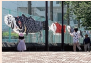
子どもたちに喜んでもらえました!

問合せ：市民協働課(市民活動支援) ☎6930-9093 FAX050-3535-8685