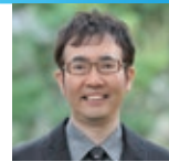
生物学者 青山学院大学教授 福岡 伸一