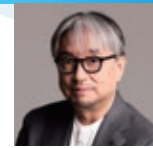
放送作家 京都芸術大学副学長 小山 薫堂