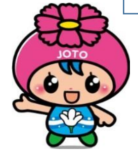
城東区マスコットキャラクター コスモちゃん