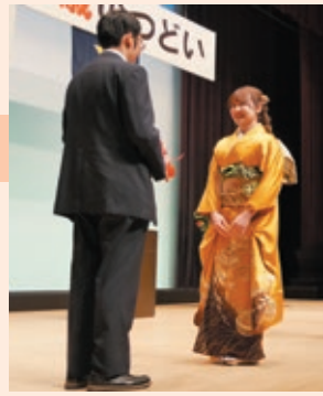
主催者より花束贈呈

本式典の開催にあたりまして、運営に協力して下さった青少年指導員の皆さま、ご協賛いただきました事業者の皆さま、誠にありがとうございました。