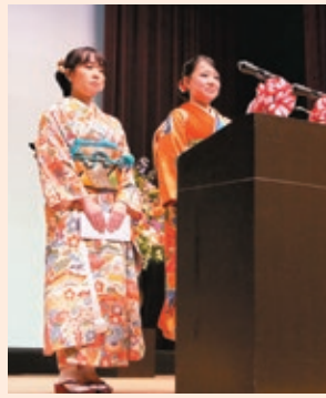
式典参加者を代表して誓いのことば

問合せ：市民協働課(市民活動支援) ☎06-6930-9093 FAX 050-3535-8685