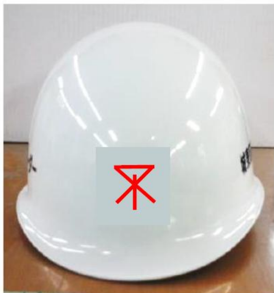
大阪市章「みおつくし」直径約 40mm