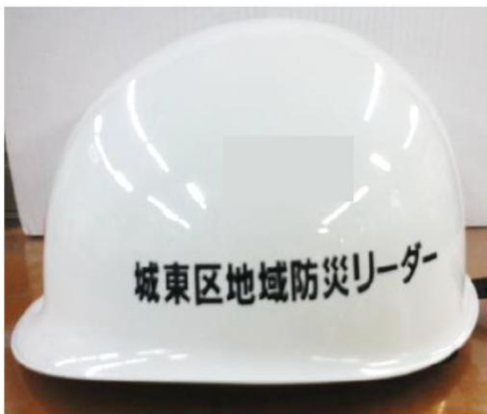
城東区地域防災リーダー