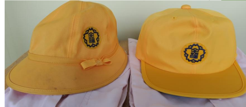
帽子(左側女子・ 右側男子) 下に重なっている のはブラウス