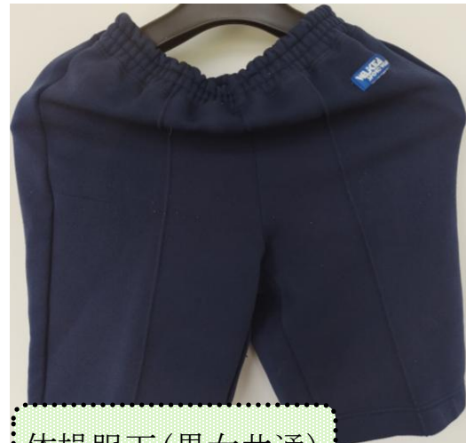
体操服下(男女共通)