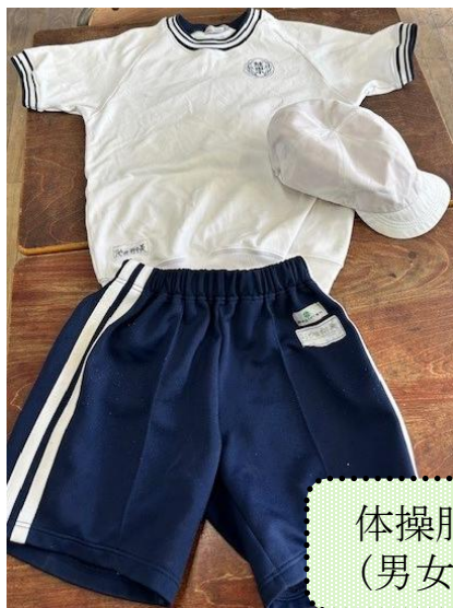
体操服半袖 (男女共通)