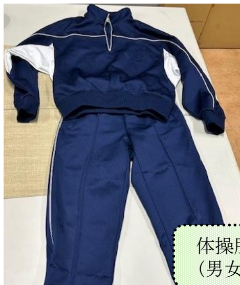
体操服長袖 (男女共通)