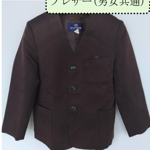
ブレザー(男女共通)