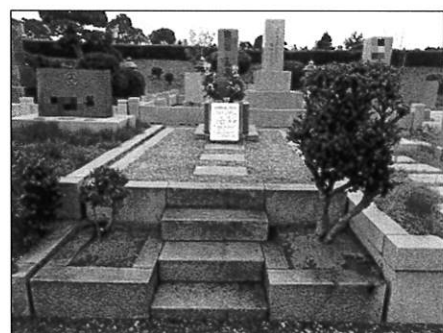
墓参代行業実施後