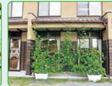
平林福祉会館 さざんか平林協議会