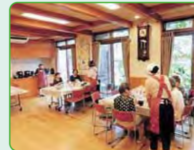
食事サービスのようす さざんか平林協議会