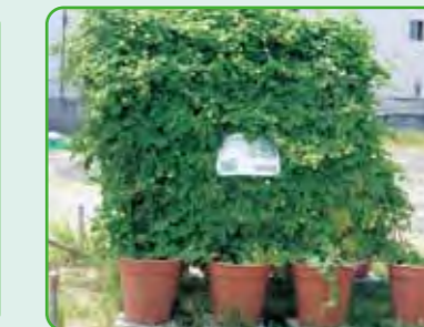
ひまわり迷路(ゴーヤ)