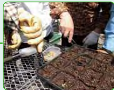
白ゴーヤの種を置いていきます。