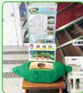
募種箱の設置(8月~10月)