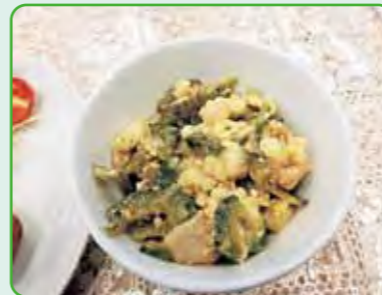
食事サービスで提供された料理 さざんか平林協議会

地域活動協議会の皆さまと緑のカーテンに取り組んでおり、平成28年度は区内7地域の福祉会館でゴーヤなどの植え付けを行いました。緑のカーテンに取り組んでいただいた地域では、ヒートアイランド対策としての効果だけではなく、地域で育てたゴーヤを食事サービスで提供するという「人と人をつなげる」効果もありました。