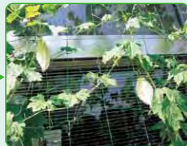
白ゴーヤが、実りました。