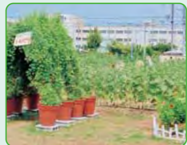
ひまわり迷路(フウセンカズラ)