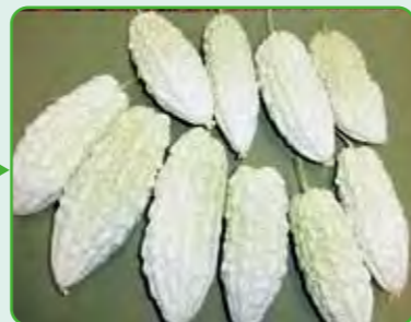
たくさん収穫できました。