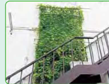
御崎福祉会館 住之江連合地域活動協議会