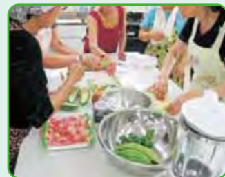
ゴーヤクッキング(8月)