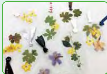
来場者に配布した、ゴーヤの押し花しおり