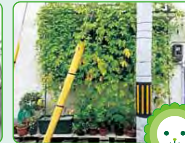
粉浜二丁目西町会会館 さざんか粉浜活動協議会