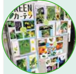
展示会 応募作品の一例