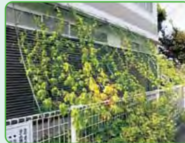
新北島南公園福祉会館 さざんか新北島協議会