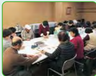
種の仕分けと袋詰め(2月~3月)