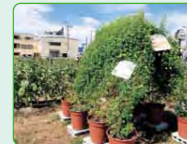
ひまわり迷路(フウセンカズラ)