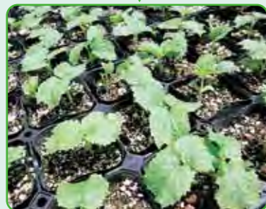
どんどん成長していきます。