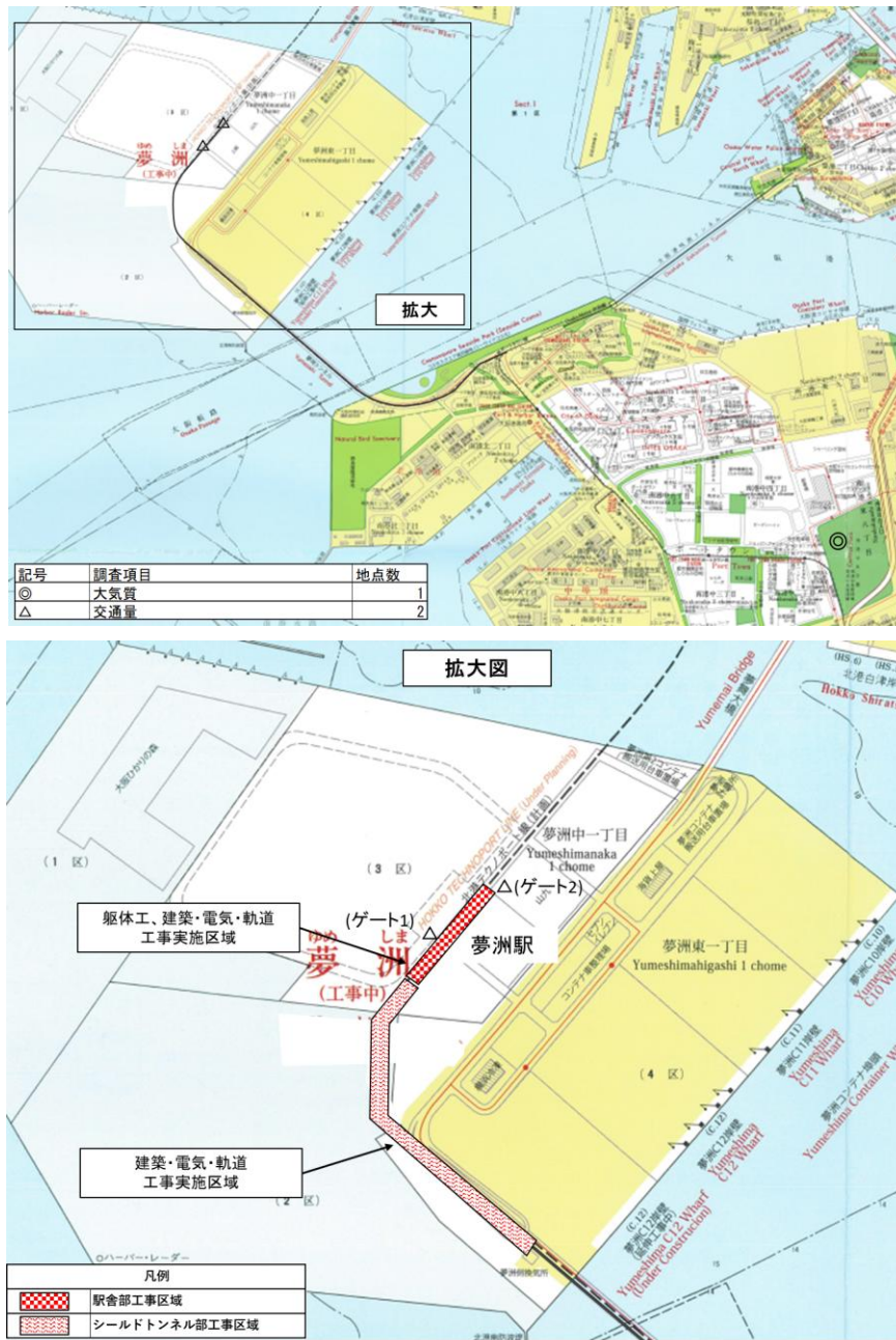
図2 調査地点位置概要図