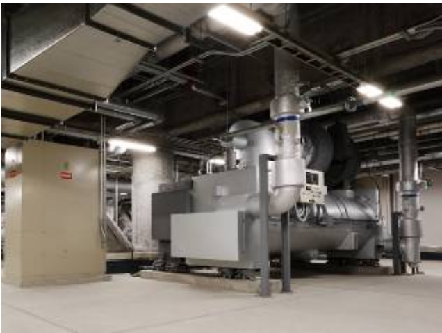
写真9 高効率熱源機器 (防振架台上に設置)