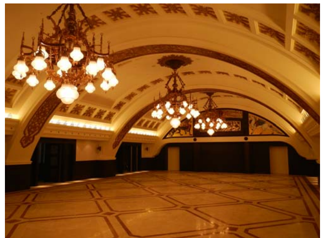
写真 18 13 階レストランの内観