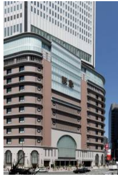
写真 14 低層部外観