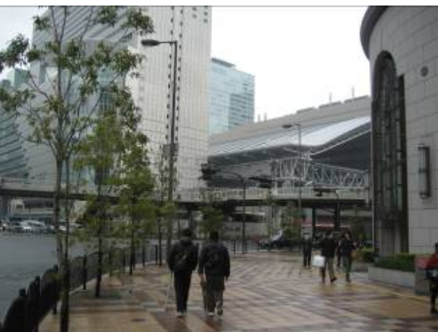
写真11 外構植栽 (シラカシ)