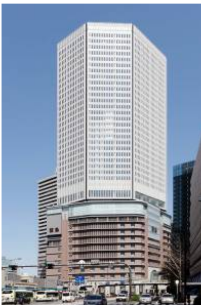
写真 17 第 1 工区完成時の外観