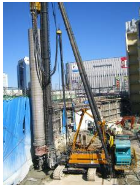
写真6 SMW 遮水壁工事の状況