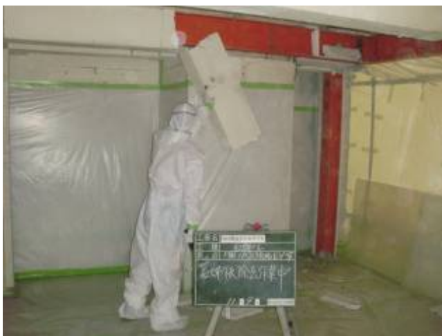
写真 23 アスベスト撤去工事