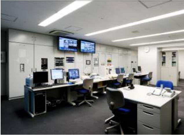
写真 13 中央監視装置（BEMS 見える化）