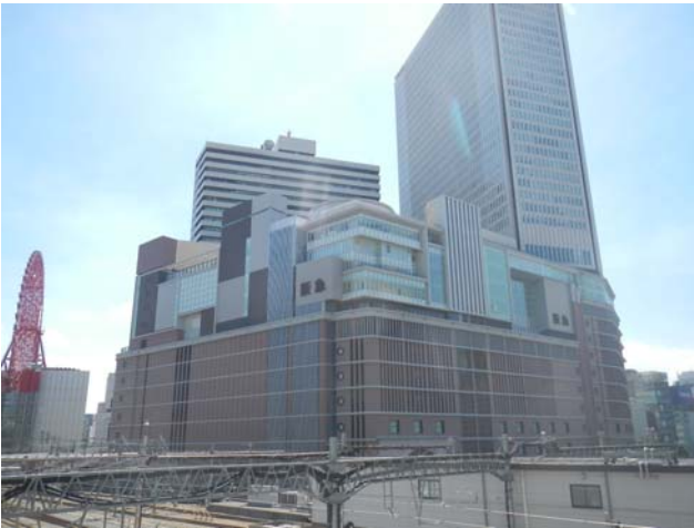
写真 15 第 2 工区全景（大阪駅側より）