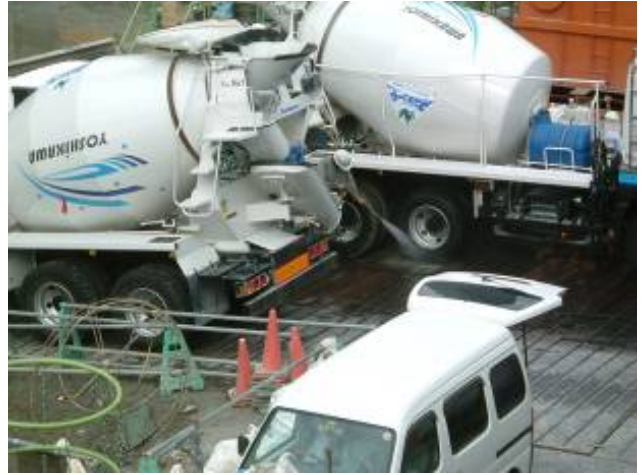
写真2 タイヤ洗浄の状況