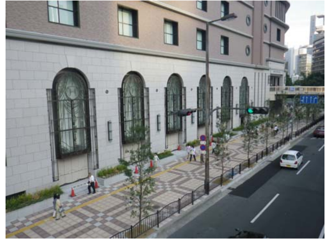
写真 16 第 2 工区西側外構の状況