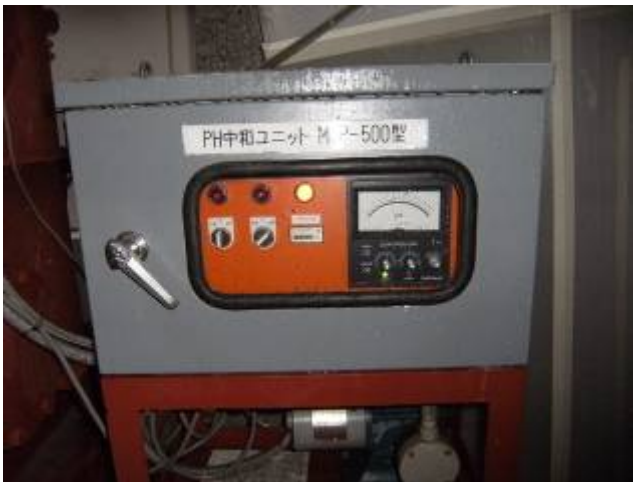
写真3 排水設備 PH 管理装置