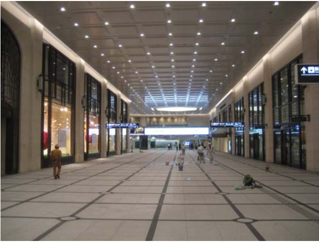
写真 19 1階コンコース