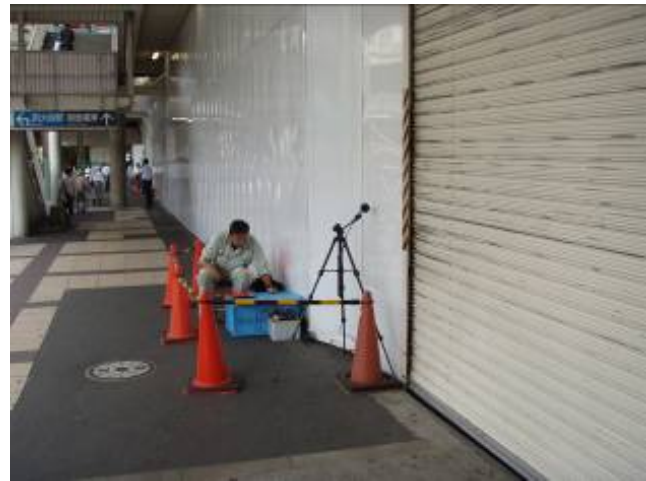
写真 22 騒音・振動現地調査の状況