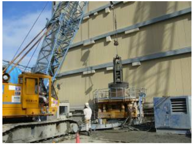
写真 20 地中障害物撤去（全旋回工法）