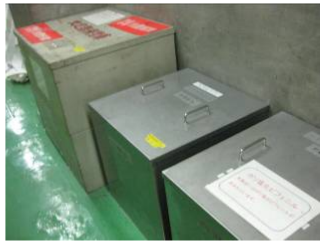
写真 24 PCBの保管状況