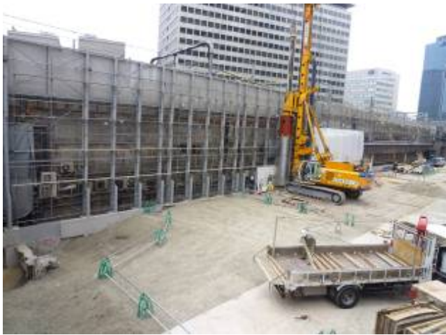
写真 21 地中障害物撤去（BG工法）