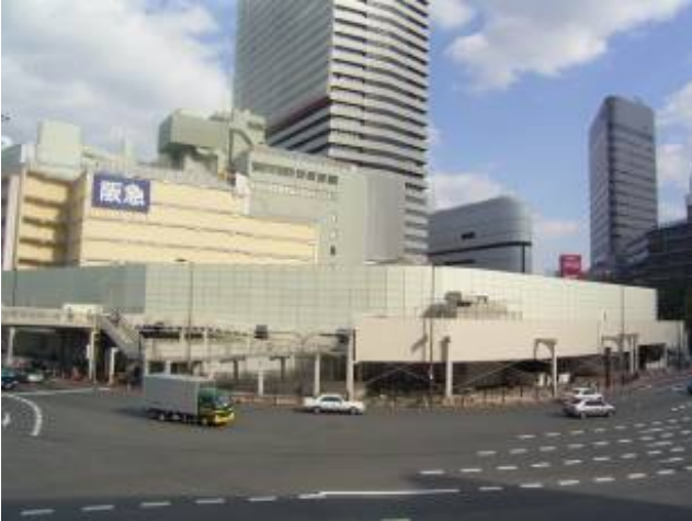
写真1 歩道構台・防音パネル設置状況