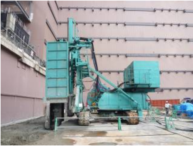
写真7 ソイルセメント遮水壁工事 (TRD 工法)