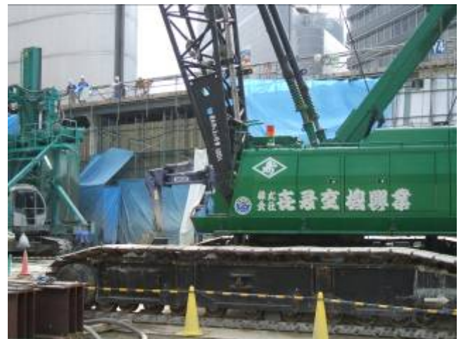
写真4 低騒音型建設機械