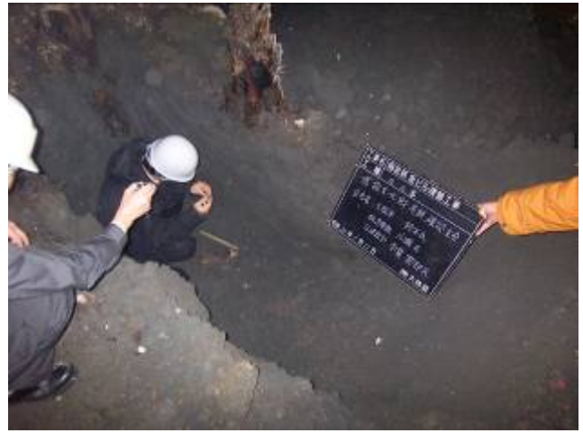
写真8 大阪市教育委員会立会