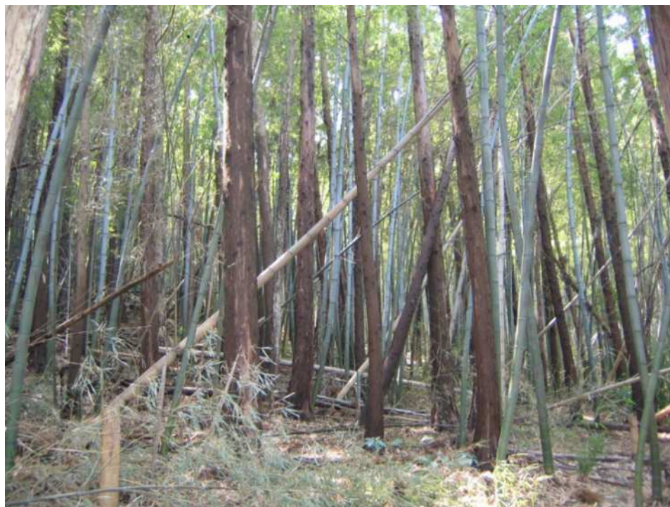
手入れされずに竹が侵入した人工林

産業構造や資源利用の変化、人口減少や高齢化に伴い、里地里山では自然に対する働きかけが少なくなりました。その結果、例えば農地や森林の管理に手が回らなくなり、耕作放棄地や放置された里山林などがシカやイノシシの生息場所となるなど、動植物相が変化し、生物多様性に影響が生じています。