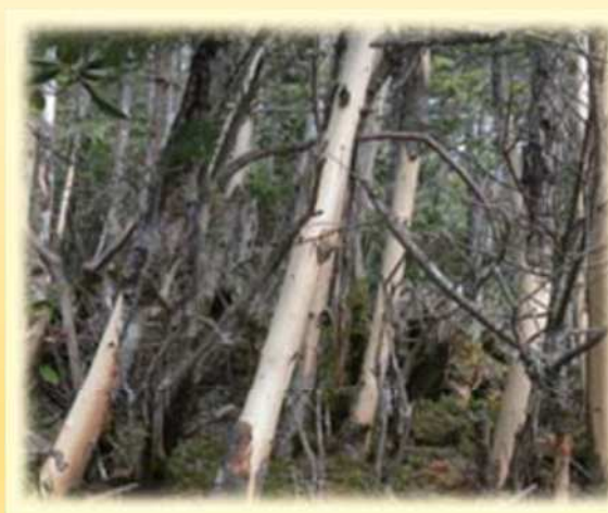
シカによる樹皮はぎとりの状況