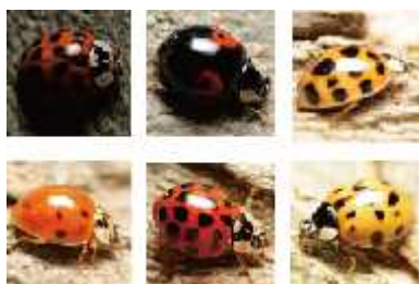
ナミテントウ

「遺伝子の多様性」とは、同じ種でも異なる遺伝子を持っているため、形や模様、生態などに多様な個性があることをいいます。同じ種であっても、例えば、テントウムシは個体によりいろいろな斑紋をもつこと、アサリの貝殻の模様は千差万別であること、ゲンジボタルは地域によって発光の周期が異なることなどが挙げられます。