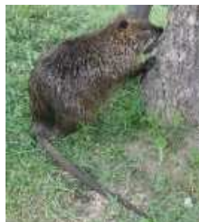
ヌートリア