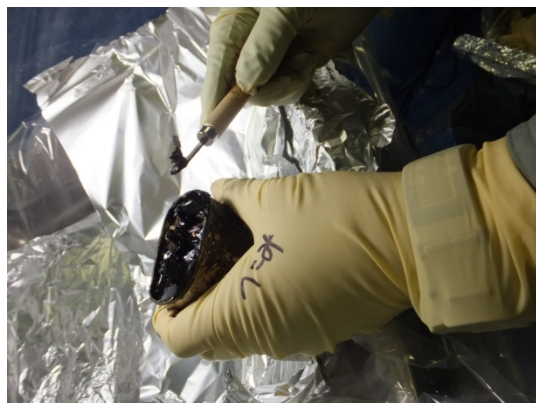
剥き身コンデンサ付着充填材の採取