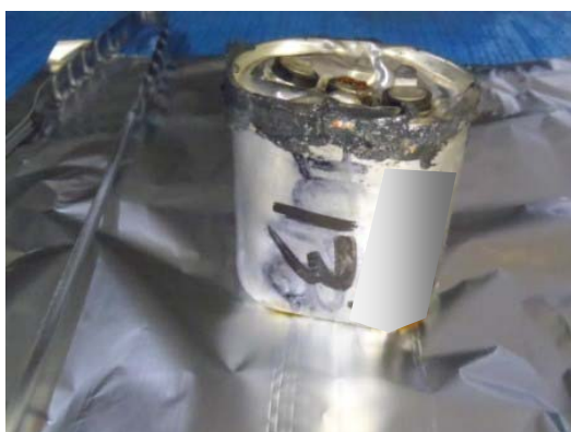
補修した剥き身コンデンサ (1)