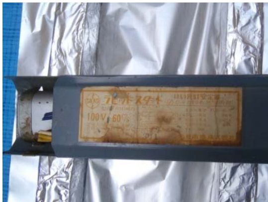
コンデンサ外付け型安定器