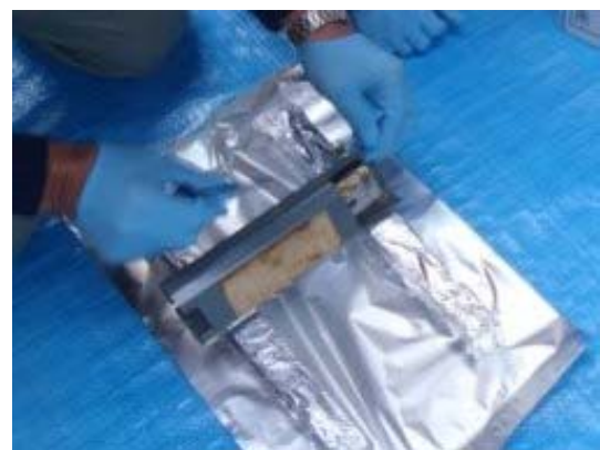
コンデンサ取り外し作業中