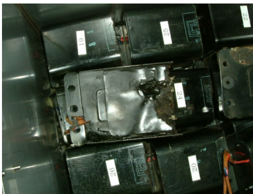
切断された廃安定器の保管例 (2)