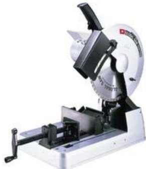
ディスクソーの例

コンデンサ充填材固定型安定器のコンデンサを含む部位と鉄心・コイルを含む部位の間をディスクソー、バンドソー等により切断し、コンデンサを含む部位のみを保管している場合がある。