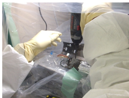
コンデンサ外付け型廃安定器充填材の採取