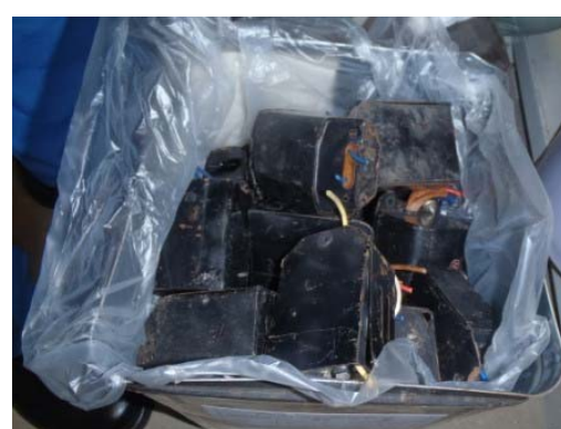
切断された廃安定器の保管例 (3)