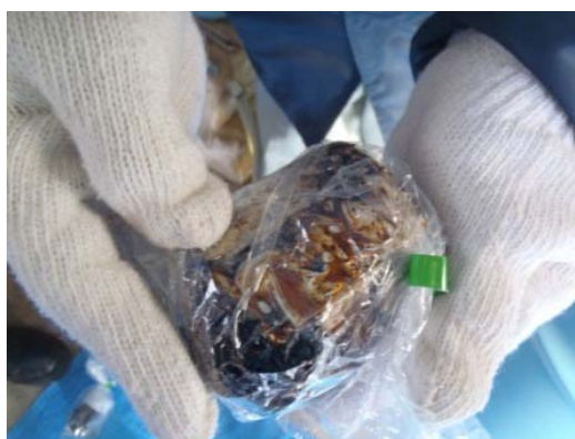
油状の液体が多量に付着した剥き身コンデンサ