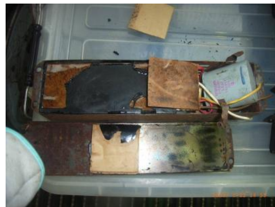
スリット付きケースの場合