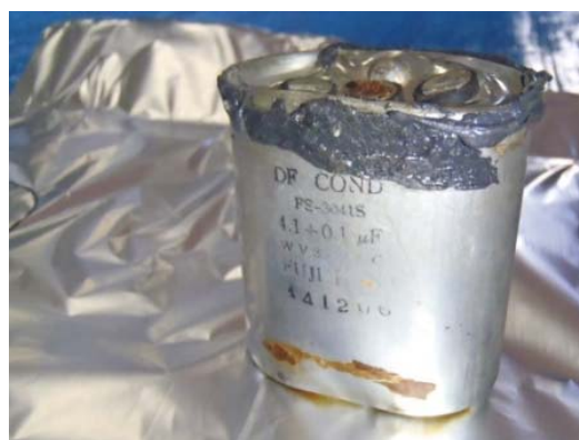
補修した剥き身コンデンサ (2)