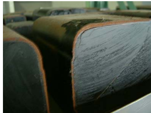
廃安定器の切断面