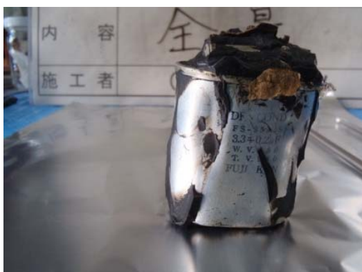
変形した剥き身コンデンサ (1)

充填材を剥いて取り出したコンデンサには、変形している事例、破損・漏洩等を目止め材で補修した事例や油状の液体が多量に付着している事例が散見される。