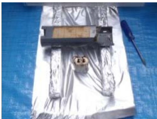
コンデンサ取り外し作業終了