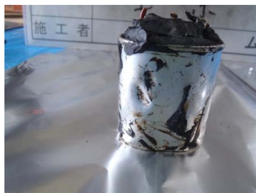
変形した剥き身コンデンサ (2)