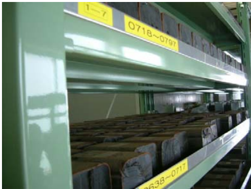
切断された廃安定器の保管例 (1)