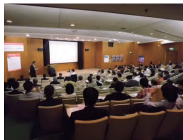
生物多様性協働フォーラム（自然史博物館 講堂）

平成24年度は、民間企業等と連携し、生物多様性の社会的認知・関心を高めるフォーラムを開催するなど、生物多様性の保全に資する活動を進めています。