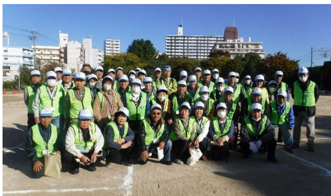
【ごみゼロリーダー記念撮影】