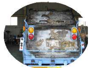
車両は使用できない状態に