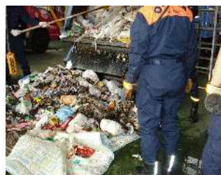
収集したごみからはスプレー缶を発見