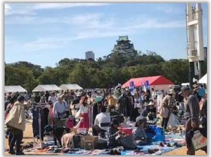
＜大阪城ガレージセールの様子＞