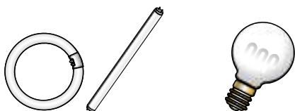
蛍光灯管（直管・環型）