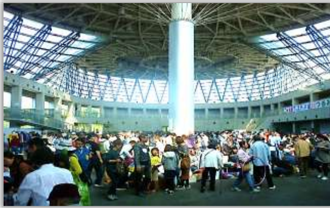
＜ハナミズキホール内ガレージセールの様子＞

鶴見緑地公園内のハナミズキホールにおきまして、11月11日（日）に鶴見区内にお住まいの方を出店対象者としてガレージセール「ごみ減量フェスティバル in つるみ」を開催いたしました。