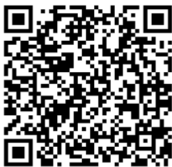
「よく分かるごみ減量・3R」 ホームページへ