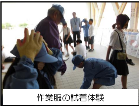
作業服の試着体験