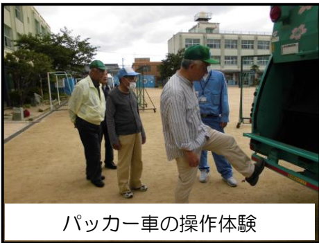
パッカー車の操作体験