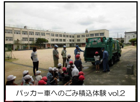
パッカー車へのごみ積込体験 vol.2

環境局では「ごみ減量・分別、3R等」に関する啓発等様々な施策を行い、循環型社会の構築をめざした事業を推進しています。その一環として、小学生が興味を持って「ごみ減量・分別、3R等」について学習することを目的に、環境事業センター職員が小学校へお伺いし小学4年生を対象に「小学校向け出前授業（体験学習）」を実施しております。