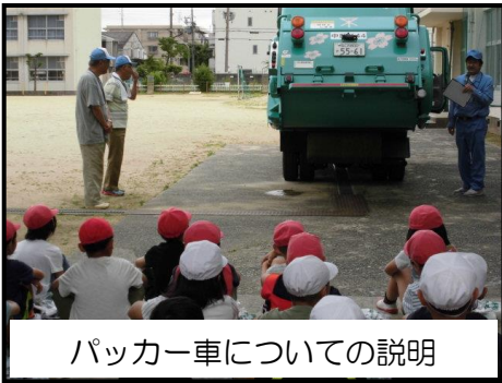
パッカー車についての説明