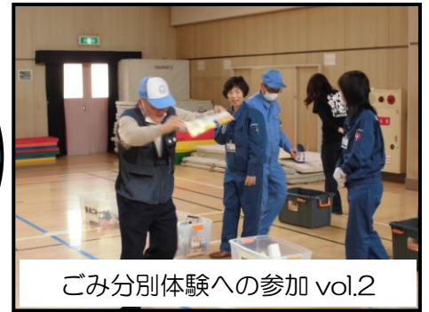
ごみ分別体験への参加 vol.2