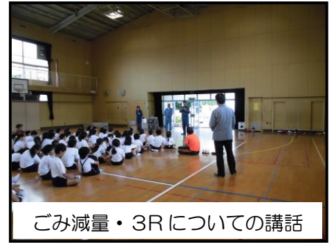
ごみ減量・3R についての講話