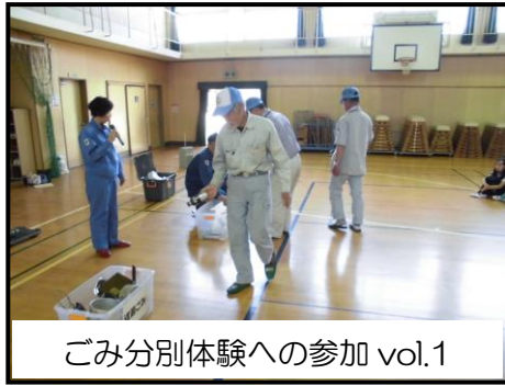
ごみ分別体験への参加 vol.1