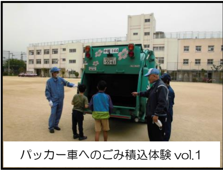
パッカー車へのごみ積込体験 vol.1