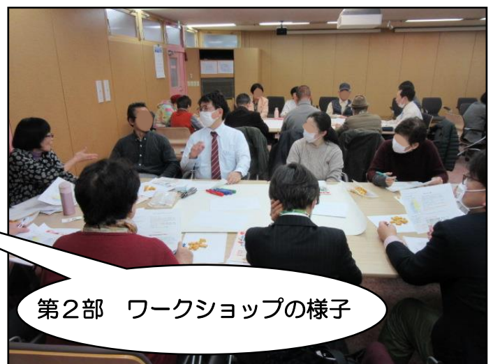
第2部 ワークショップの様子