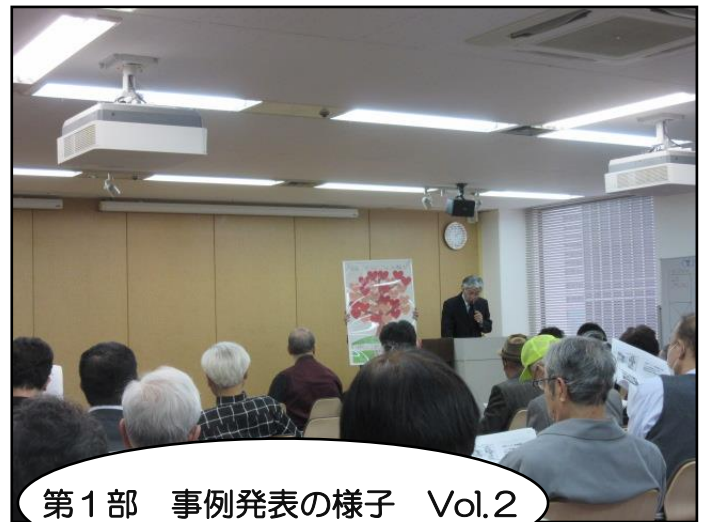
第1部 事例発表の様子 Vol.2