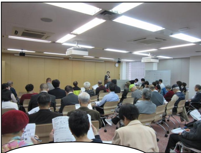
第1部 事例発表の様子 Vol.1

今年度については、五条連合から1名、真田山連合から2名ご参加いただき、それぞれのテーマにおいて知識の習得に役立てていただきました。