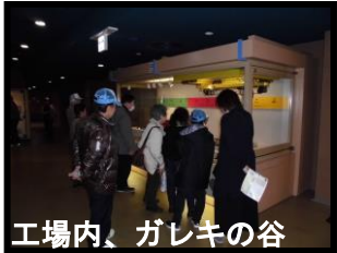
工場内、ガレキの谷