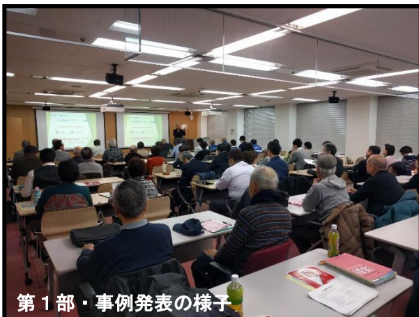
第1部・事例発表の様子

平成31年2月7日（木）大阪産業大学 梅田サテライトキャンパスにおいて、大阪ごみ減量推進会議主催の「ごみ減量市民交流会2019」が開催されました。