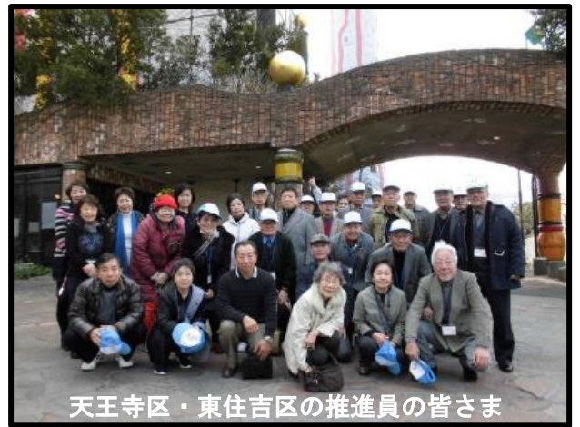
天王寺区・東住吉区の推進員の皆さま