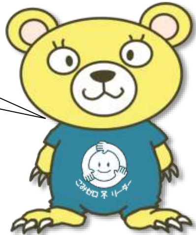
中部環境事業センターオリジナルキャラクター：クマチュー