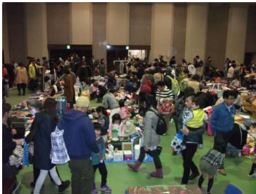
区民センターに30ブースの出店で大盛況のガレージセール