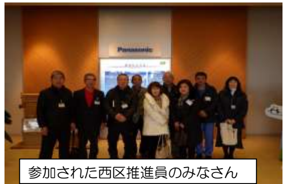
参加された西区推進員のみなさん

平成29年3月10日（金）兵庫県加東市にあるパナソニックエコテクノロジーセンター（株）へ見学に行ってきました。使用済み家電製品（テレビ、エアコン、冷蔵庫、洗濯機）の解体作業や、解体後の部品や素材が無駄なく分類され再生資源として新たに生まれ変わっていく工程を知ることができ、大変有意義な施設見学会となりました。