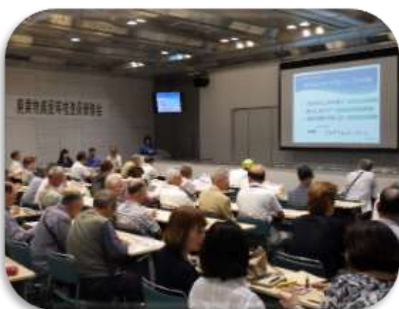
廃棄物減量等推進員研修会の様子