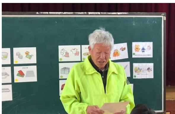
巽東連合・川合推進員(巽東小学校)

4月に生野区巽南小学校、東桃谷小学校、巽東小学校、5月に鶴橋小学校、小路小学校、東中川小学校、東小路小学校で開催した4年生対象の体験学習において、各学区の廃棄物減量等推進員（ごみゼロリーダー）の皆さんに参加して頂きました。