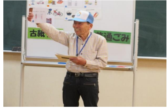
小路連合・矢本推進員(小路小学校)