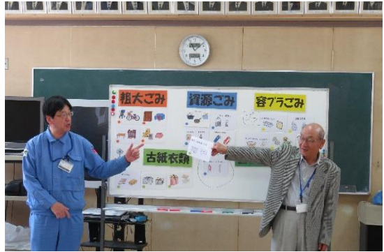
東小路連合・植松推進員(東小路小学校)