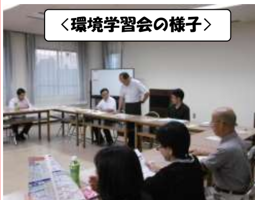
＜環境学習会の様子＞

■ 学習会では、「“わたしのまち・きれいな大阪”をめざして」と題し、当センター職員から大阪市の廃棄物処理計画や取り組みのほか、「ごみ減量」「3R」についての説明の後、質疑応答・意見交換を行ないました。これからも、推進員の皆さまを中心に地域の皆さまと協力しながら、より一層ごみ減量に取り組んでいきたいと考えています。