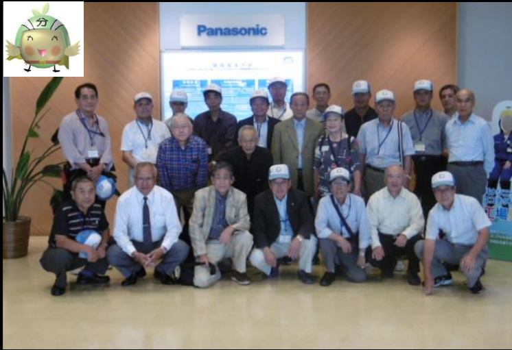
研修での集合写真「住之江区・住吉区推進員の皆さま」

■平成28年10月4日（火）に、住之江区12名、住吉区11名の廃棄物減量等推進員の皆さまにご参加いただき、兵庫県加東市にあるパナソニックエコテクノロジーセンター(株)において、「使用済み家電製品をリサイクルする工場」の施設見学を実施しました。家電製品（家電4品目・6機器）リサイクルについて施設見学を通じ廃棄物減量等推進員指導者の皆さまに学び理解を深めていただき地域のごみ減量の周知啓発活動を実践いただく有意義な研修となりました。