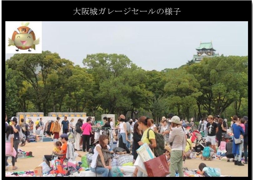
大阪城ガレージセールの様子

また今回は、太陽の町連合の廃棄物減量等推進員（ごみゼロリーダー）、2名の方にご参加いただき、スタッフとしてご従事いただきました。大変蒸し暑い中での開催でありましたが、無事実施することができました。本当にありがとうございました。今後もリユースの推進を進めてまいりますのでご協力をお願いします。