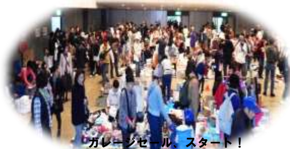
ガレージセール、スタート！ ～にぎわうガレージセール会場

当日は、天気も良く、3連休の最終日にも関わらず、出店ブース・イベント会場は開始からとても大勢の方でにぎわいました。