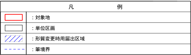
形質変更時要用届出区域図