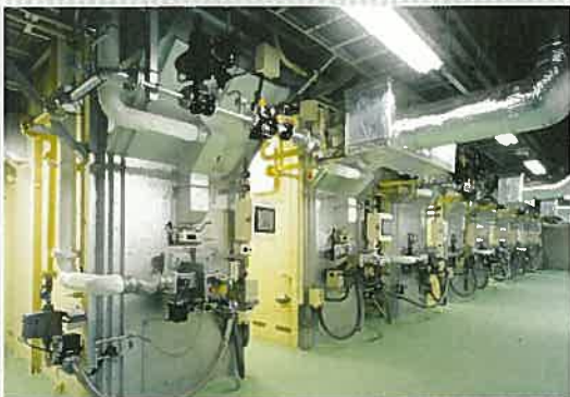
環境に配慮した、最新鋭の設備