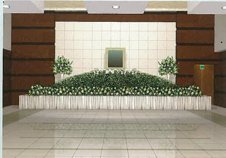
式場 大規模葬祭(400席)が行える式場で1,000人までご会葬いただけます。大理石板を設置した祭壇は花飾りや幕なしでも効果的に演出でき、葬儀はもちろん、偲ぶ会などにもお使いになれます。