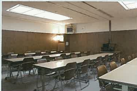
多目的室 仕上げ(精進上げ)の会食会場など多目的にご利用いただけるお部屋です。