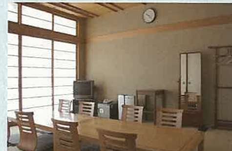
宗教者控室 広々とした和室は、宗教者様がおくつろぎの場としてご利用いただけるお部屋です。