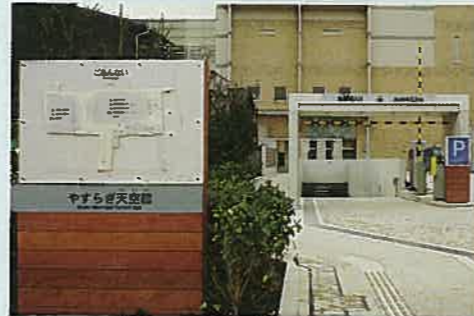
外観 暖色系の淡い色合いのタイル壁面が、おこなやかな雰囲気を出しています。