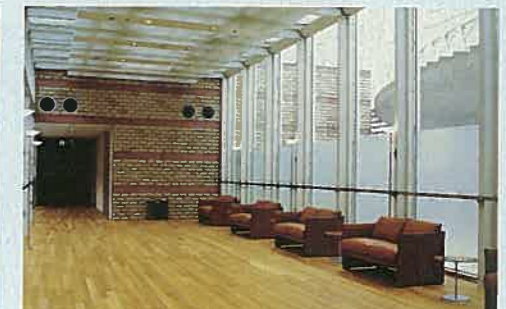
やすらぎのコーナー 外からの光をふんだんに取り入れたスペース。ご参列の皆様にご休憩いただけます。