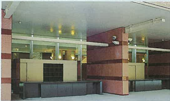
受付・クローク・帳場 受付には車いすもご用意。背後には使い勝手のよいクロークを設置しています。机やコートスタンド、金庫などを常備した帳場では手際よく作業ができます。

穏やかでやすらぎに満ちた天空に、飛び立てるようにとの願いを込めた「やすらぎ天空館」。大阪市が手がけた都心部のこれまでにない近代的な葬祭場で、社葬や個人葬、さらにお通夜やお別れ会、偲ぶ会にいたるまで、故人にふさわしいセレモニーが執り行えます。祭壇に大理石板を配した200席の2式場をはじめ、控室やロビーなど各種施設、サービスの充実をはかっております。