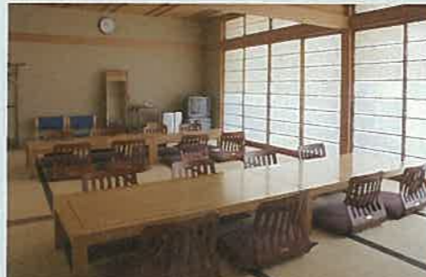
親族控室 木製の座卓と座椅子を並び、テレビや金庫、衣桁、姿見もご用意。ご会食にもご利用いただけます。