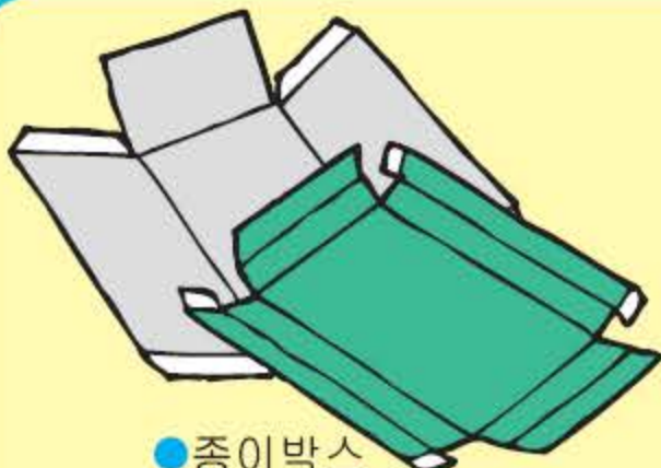
●종이박스 (접어서 배출해 주십시오.)