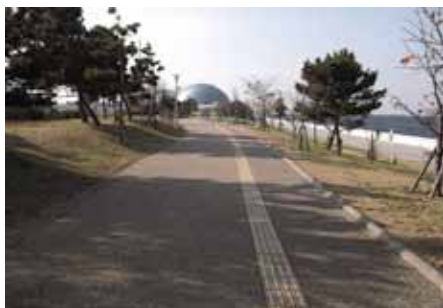
コスモスクエア海浜緑地

臨海部での緑地や親水堤防等を整備し、ウォーターフロントの特性を生かして、市民や港を訪れる人々が憩い、集える緑地整備を進めています。