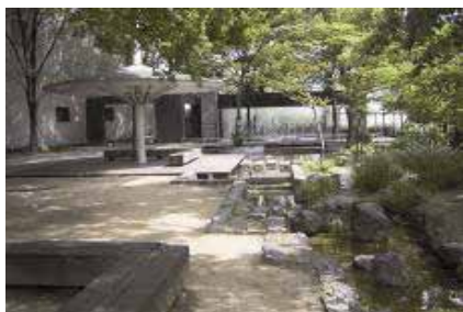
海老江下水処理場のせせらぎ（四季の里）

快適環境・リサイクル型社会の実現に貢献するため、下水処理水の有効利用を進めており、「せせらぎ」のある修景施設などに利用することで、美しい水辺空間を創造しています。