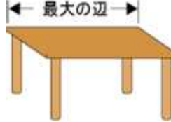
【四角いテーブルなど】最大の辺