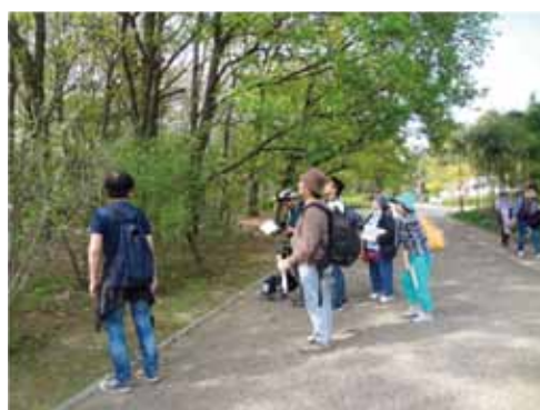
生き物調査の様子

身近なところでの自然豊かな場所で生き物や植物を市民とともに発見していくため、生き物調査を実施しています。