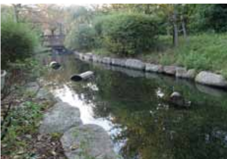
中浜下水処理場のせせらぎ

快適環境・リサイクル型社会の実現に貢献するため、下水処理水の有効利用を進めており、「せせらぎ」のある修景施設などに利用することで、美しい水辺空間を創造しています。