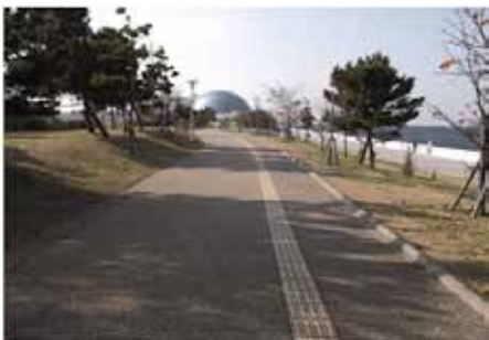
コスモスクエア海浜緑地

臨海部で、ウォーターフロントの特性を生かして、緑地や親水堤防等、多くの市民や港を訪れる人々が憩い、集える空間を整備しています。