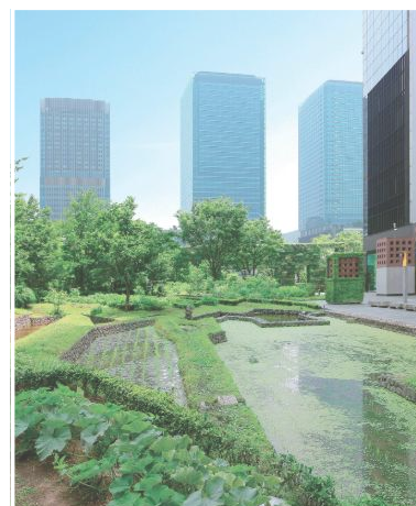
「新梅田シティ 新・里山」