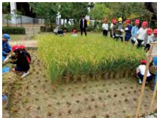
「せせらぎの里」での農事体験の様子

鶴見緑地内にある自然体験観察園の水田や畑において、農事（田植え等）体験や講座を実施しています。また住之江抽水所にある「せせらぎの里」では近隣の小学生を対象とした田植えや稲刈りの体験行事を実施しています。