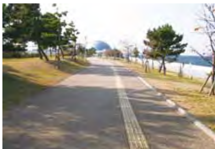
コスモスクエア海浜緑地

臨海部で、ウォーターフロントの特性を生かして、緑地や親水堤防等、多くの市民や港を訪れる人々が憩い、集える空間を整備しています。