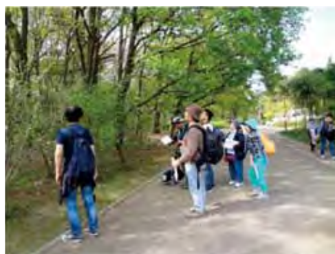
生き物調査の様子

身近なところでの自然豊かな場所で生き物や植物を市民とともに発見していくため、大阪城公園など市内12か所において生き物調査を実施しました。平成30年度は、新たに市立小学校30校において、3・4年生と一緒に校内に生息・生育する生き物の調査を実施しています。