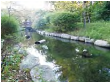
中浜下水処理場のせせらぎ

快適環境・リサイクル型社会の実現に貢献するため、下水処理水の有効利用を進めており、「せせらぎ」のある修景施設などに利用することで、美しい水辺空間を創造しています。